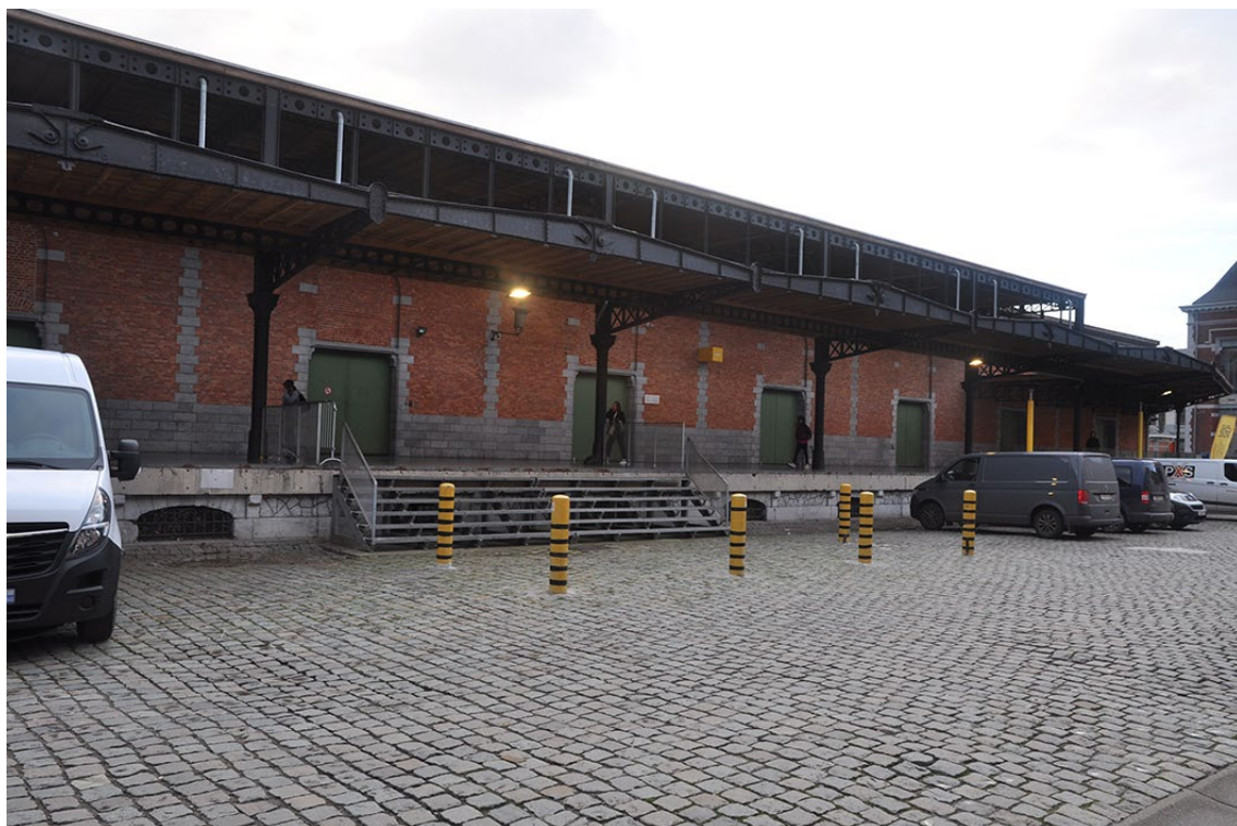
Vue 7 – façade ouest - Sheds