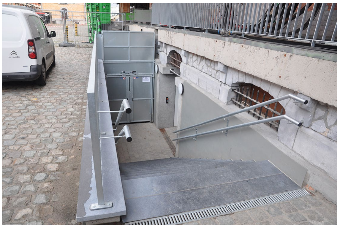
Vue 8 – façade ouest – accès sous-sol - Sheds