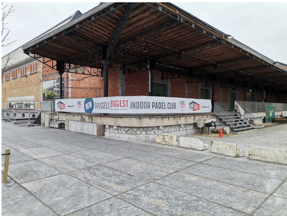
Vue 6 – façade ouest - Sheds