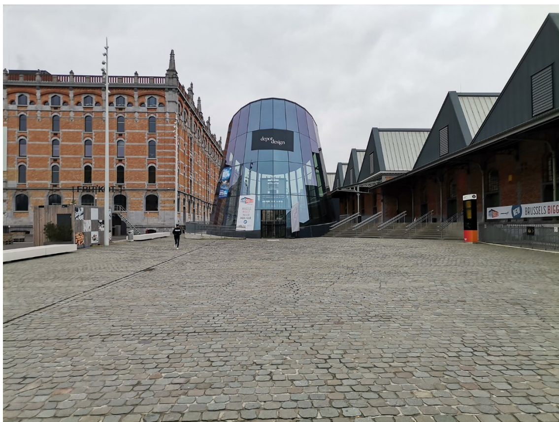
Vue 2 – façade est – Sheds et Entrepôt Royal