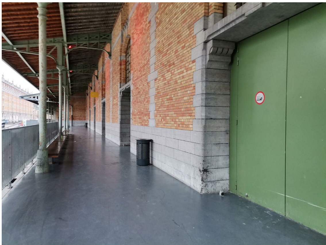
Vue 3 – façade est - Sheds