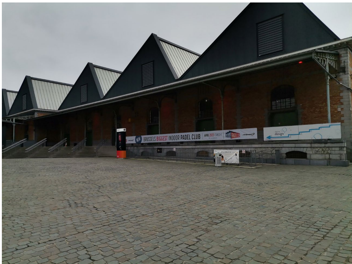
Vue 1 – façade est - Sheds