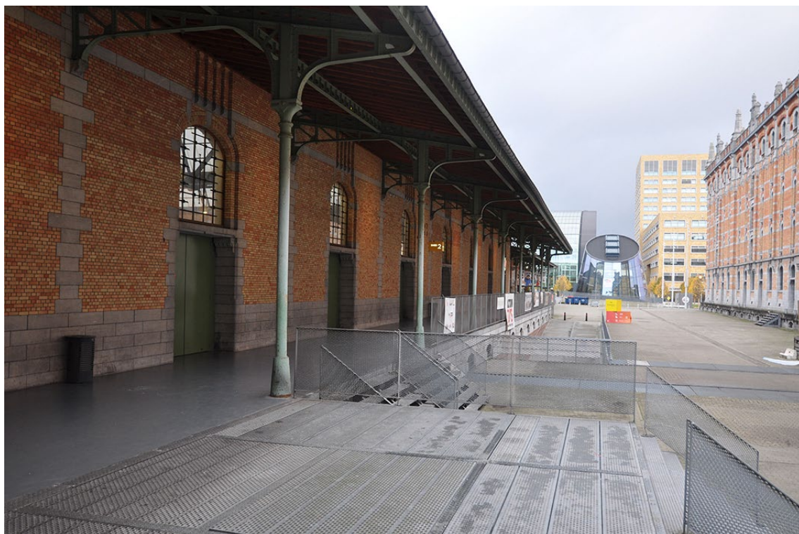
Vue 5 – façade est et quais extérieurs - Sheds