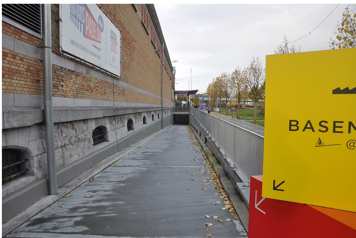
Vue 4 – angle façades est et nord - Sheds